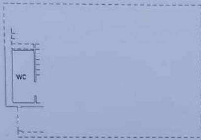
PIANO TERZO SOTTOSTRADA H. 260